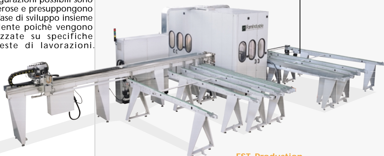
Linea di taglio e lavorazione

_Linee automatizzate Taglio e lavorazione, Semi automatiche, Assemblaggio imballaggio